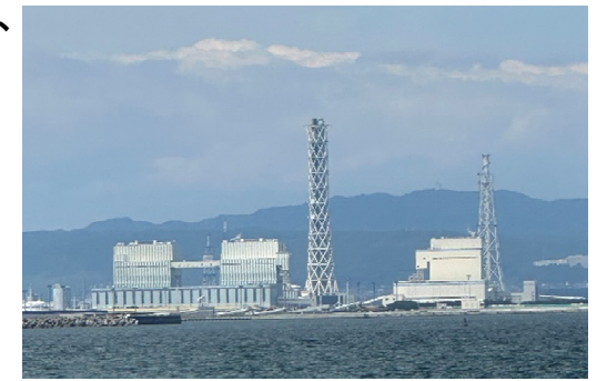
常陸那珂火力発電所(左)と常陸那珂共同火力発電所(右)

今年は東海村政70周年の節目の年、常陸那珂火力発電所の煙突にイルミネーションが点灯する日が来ることに大いなる期待を寄せて。