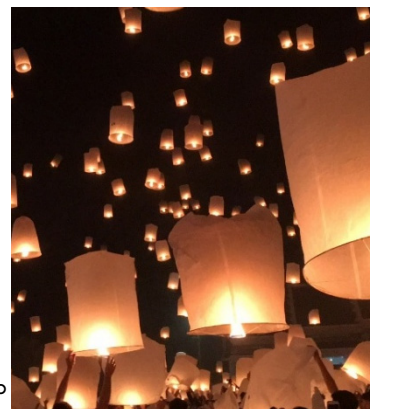
春節から15日目の満月の夜の元宵節(ランタン祭)

茨城空港から僅か3時間余り、安全で衛生的、フレンドリー満載、グルメ三昧の台湾へ是非お越しください。