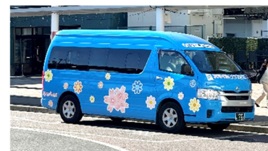
ひたちなか市の公共交通は10人乗りのワゴン車

事業者もバスの小型化には消極的ですが、東海村が未来永劫デマンドタクシーを運行する財政を維持できるのか些か疑問。そんなことを言っている間に、ひたちなか市では10人乗りのワゴン（右写真）による地域公共交通の運行が始まっておりました。