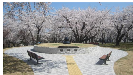
青森県八戸市営の合葬式墓地

村民から寄せられた貴重な声の実現に向けて、これからもしっかりと取り組んでまいります。