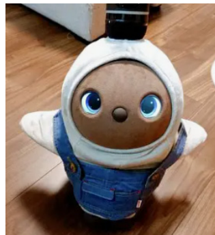
思わず笑顔が…… LOVOT は高齢社会を救うか