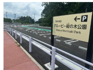
増設された駐車場が完成

東海病院脇のグルービー縦の木公園（神楽沢近隣公園）の「駐車場増設工事」が完了してこのほど供用開始されました。この増設が、村民の安全・安心や今後の村発展に十分寄与することを切に願っております。引き続き、利用状況に注視します。