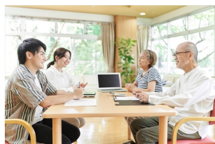
早めに家族会議を

夫婦2人+こども2人程度の核家族世帯が日本に定着した結果、こどもが進学や就職で東海村から離れて戻って来ない我が家の様なご家庭は多く、そのうち、不幸にも夫婦の何れかが先立つことになると、残された資産の処分が容易にできずに経済難に陥ったり、空き家が増える事象が散見されています。