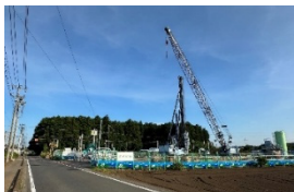
須和間踏切付近の現場

国道 6 号の那珂市向山地区から船場地区を經由し、JR 常磐線の須和間踏切を高架上で交わして、須和間北交差点から通称バチ山を抜けて緑ヶ丘団地の南側を通る水戸外環状道路の工事が始まりました。この道路は、最終的に国道 245 号線の常陸那珂港入口に接続される高規格道路として、常陸那珂港を中心とする東海村やひたちなか市の発展に寄与する大動脈、今後、道路沿線の活性化が見込まれます。