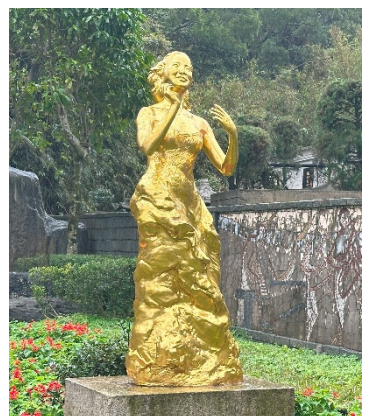
テレサ・テン記念公園

彼女は今、台北市から車で 1 時間余りの閑静で美しい墓陵に眠っています。台湾との良好な関係維持に努めたテレサ・テンの秘めたる偉大な功績に思いを致し、茨城から僅か 3 時間余りの台湾が皆様をお待ちします。茨城県が誇る空港事業、「台湾は、便利な茨城空港から」、今のところ駐車場無料です。