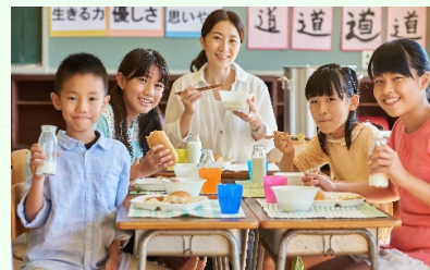
学校給食費の助成でコロナ禍支援と持続可能な社会の実現を

学校給食費の無償化は、県内の他の自治体でも始まっています。就学家族を持つ家庭の実に7分の1が貧困に陥っているというデータから、東海村も決して例外ではないという観点において、また、将来的には社会投資の一環としての給食費無償化は極めて意義のある事業です。今後も学校給食費の無償化実現に向けて継続的に取り組みながら、SDGsの理念である「誰ひとり取り残さない持続可能な社会形成を目指して参ります。