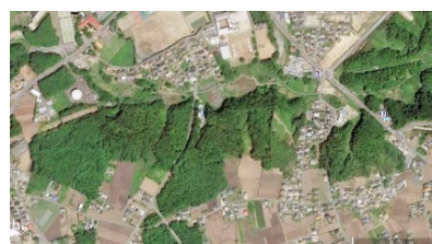
写真:現地付近 Google Earth

一昨年着工し、本年3月竣工予定と公表されていた「須和間・村松地区メガソーラ」：地元通称「バチ山ソーラ」出力12MWの工事は一向に進んでおらず、今後の無管理放置が心配。事業者や関係者の説明を求めて参ります。